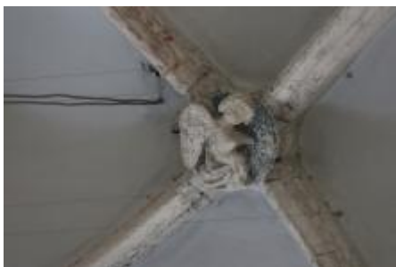
Clef de voûte, ange de Matthieu.