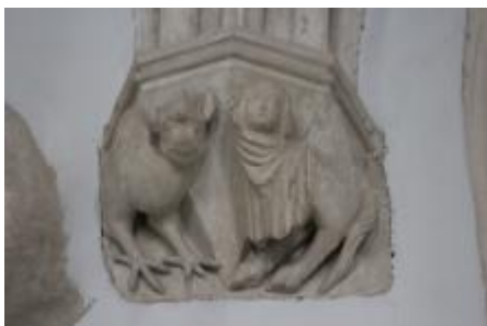
Console, êtres hybrides affrontés.