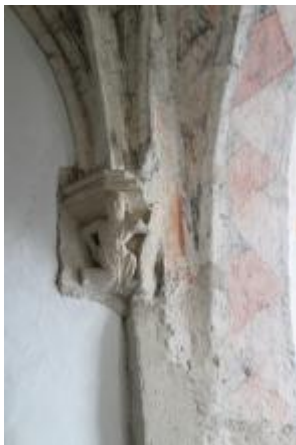
Console sculptée. Traces de polychromie.