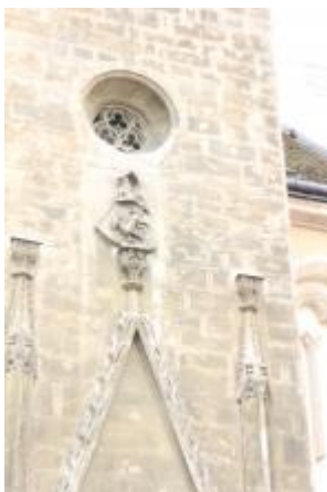
Armes des Gaissel, au-dessus de la porte d'entrée.