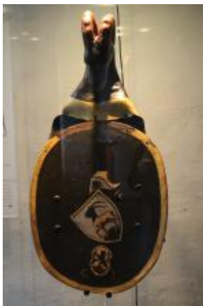
Armes d'Henri Gaissel, provenance inconnue, XV e siècle.