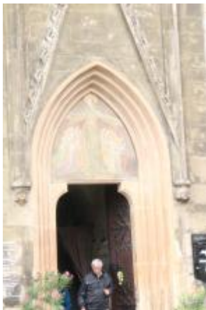
Vierge au manteau, entrée de l'église.