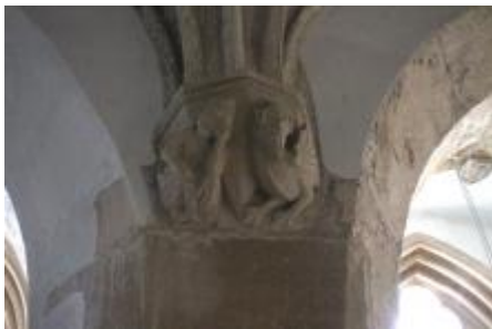
Console, personnage méditant et hybride.