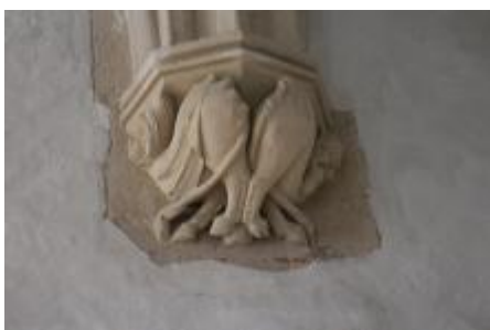
Console, êtres hybrides.