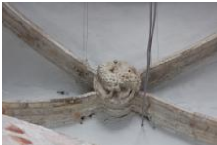
Clef de voûte, Agnus Dei.