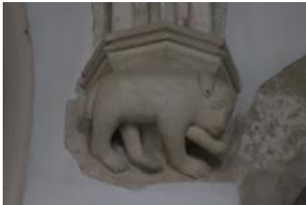
Console, ours (?)