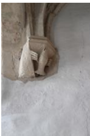
Console, signe du zodiaque.