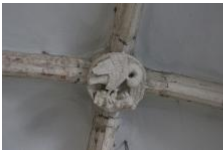
Clef de voûte, aigle de saint Jean.